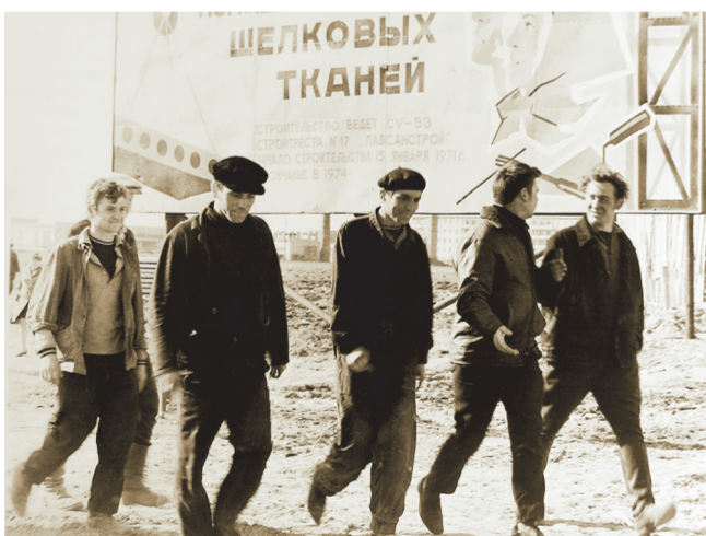
НА СНИМКЕ: Апрель 1971 г. Лавсанстроевцы идут на объекты КШТ.